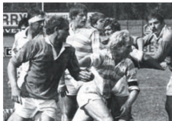
Jean-Pierre Rives sous nos couleurs, en 1984.