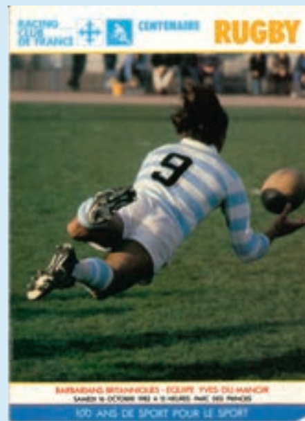
Taffary à la une de la revue du Racing