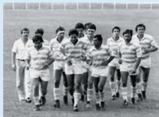
À l'échauffement, 1981.