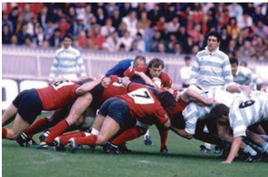
Finale 1987 : Au Parc des Princes Racing - Toulon 12-15.