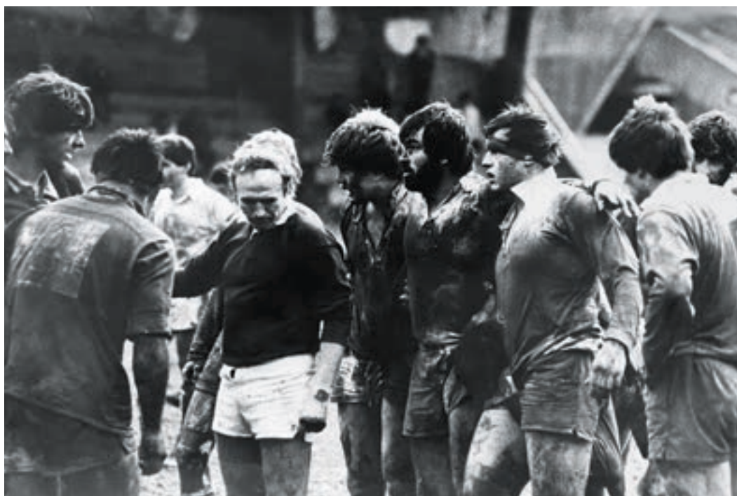
Challenge Yves du Manoir. Contre Dax, le 6 février 1983.