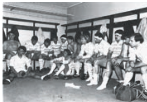
Avant-match, en 1984.

- Retour, à Dijon : RCF - Montchanin : 27-10